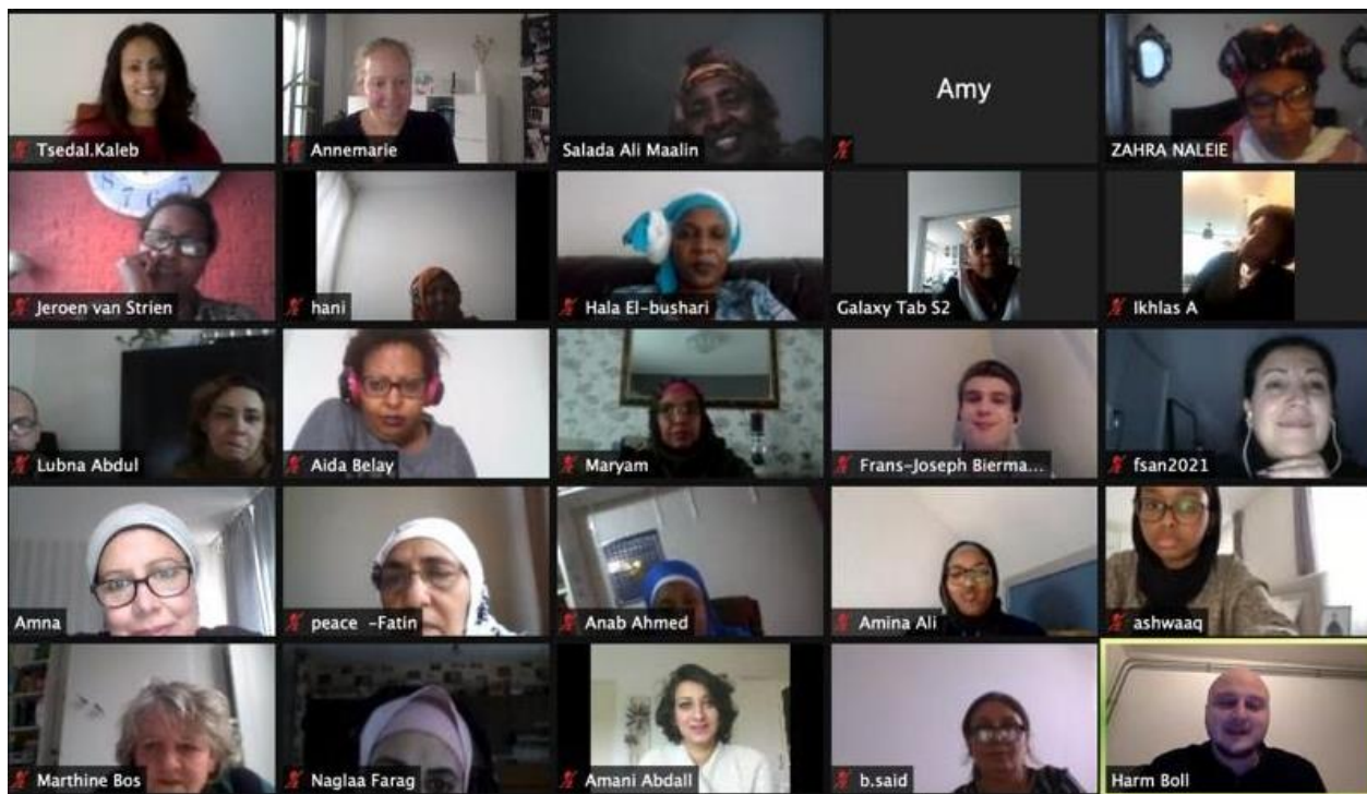
Muuqaalka ka qeyb galayaasha tababarka aqoonkorarsiga ee qadka Zoom-ka

“Waxa uu ahaa kulan muhiim u ah wacyigeliyayaasha inay wax badan ka fahmaan dhinaca arrimaha sharciga Netherlands ee ka dhanka ah gudniinka gabdhaha”